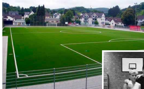
Neuer Kunstrasen in Gummersbach

Das Merkmal DJK im Vereinsnamen ist Symbol für Stärke und Vertrauen nach innen und außen. Wir freuen uns, dies mit DJK Eigenmitteln nachhaltig zu unterstützen. Mitgliedschaft soll sich lohnen!